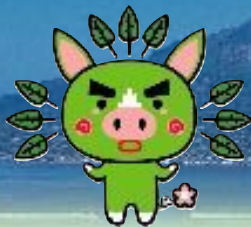
第28回全国都市緑化かごしまフェア マスコットキャラクター ぐりぶー